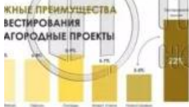
График сравнения с другими типами инвестирования

Клубный клуб - отель «ПУШКИН ПАРК» оживившись на береговой линии Учинского водохранилища обладает высоколиквидным потенциалом и станет прекрасным выбором, как для инвестора, так и для тех, кто ищет эксклюзивное жилье для загородной жизни и отдыха на берегу с набережной в экологическом чистом месте.