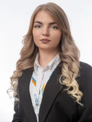
Теплова Татьяна Андреевна

Комнат: 1 7 437 500 руб. Этаж: 2 из 5 Площадь: 17.5 м 2 425 000 руб./м 2 Жилая: 14.5 м 2 ID: 1332188 Кухня: 3 м 2