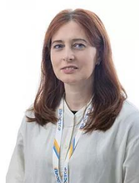
Титова Марина Валерьевна

Комнат: 3 12 199 000 руб. Этаж: 14 из 17 154 223 руб./м 2 Площадь: 79.1 м 2 Жилая: 44.7 м 2 Кухня: 12.5 м 2 ID: 904964