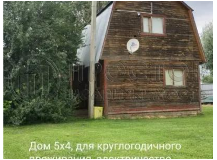
Дом 5x4, для круглогодичного проживания, электричество