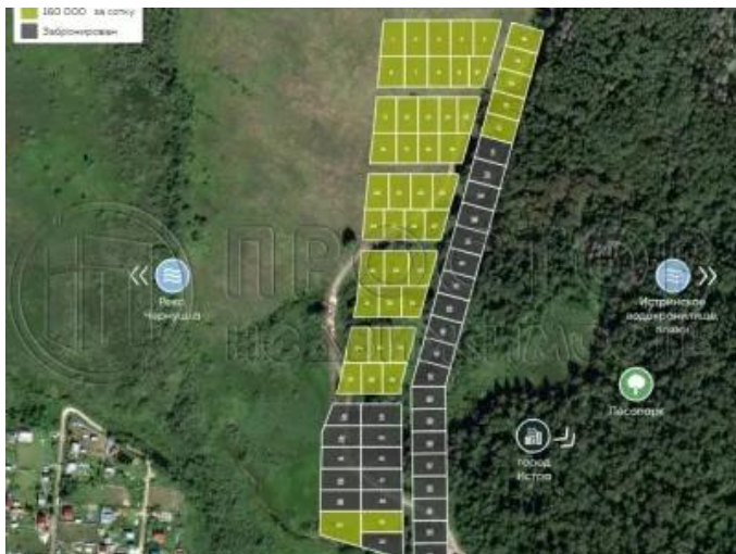
Живописное место в 40 км от Москвы на берегу Истринского водохранилища